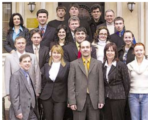
Апрель 2006 г. конференция, приуроченная к 10-ти летию компании

За годы нашей практики нами подготовлено и опубликовано более 100 статей, материалов и комментариев в средствах массовой информации, в т.ч.и Lloyds' list, World Cargo news, Maritime Law Brief, the Ukrainian Journal of Business Law т.д. Приятно, что за эти годы мы установили тесные партнерские отношения с такими уважаемыми изданиями как Судостроение, Порты Украины, Фарватер, Генеральный директор, Республика Транспорт, Юридическая практика, Весь Транспорт и т.д. С материалами можно ознакомиться на нашем сайте.